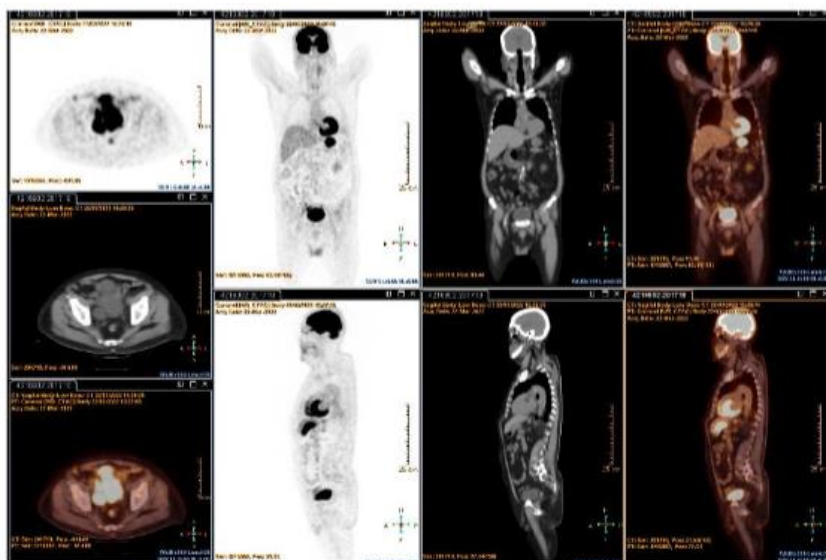
Fig. 2- Adenocarcinoma de estómago confinado al órgano

Puede valorar la respuesta al tratamiento, pero todavía no existen datos sobre si esto modifica los resultados en el paciente. (3) Figura 2