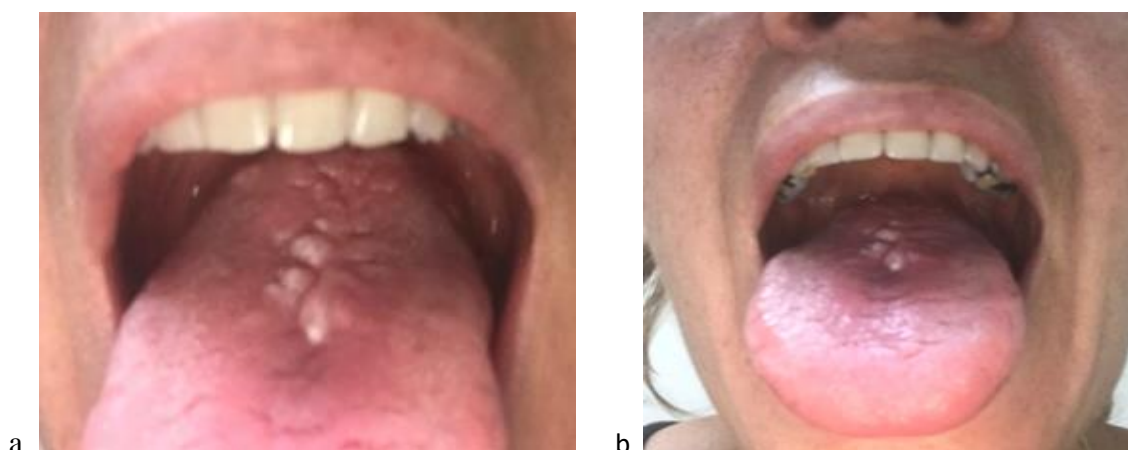
Fig. 1 (a y b)- Glositis romboidal media

Como diagnóstico clínico se planteó lesión compatible con leucoplasia homogénea, luego de realizar el diagnóstico diferencial con el carcinoma in situ. Se realizó la exéresis con biopsia y el diagnóstico definitivo fue leucoplasia homogénea.