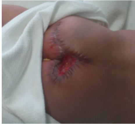
Figura 6. Herida quirúrgica dehiscente e infectada.

El colgajo en forma de V sufrió una dehiscencia de la herida. Al séptimo día del post operatorio presentó una infección de sitio quirúrgico, con elevación de los reactantes de la fase aguda. Se realizó un cambio de antibióticos con Meropenem y Vancomicina y se aplicaron curaciones sistemáticas. (Ver Figura 6)