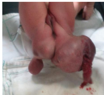
Figura 1. Tumoración sacrococcígea.