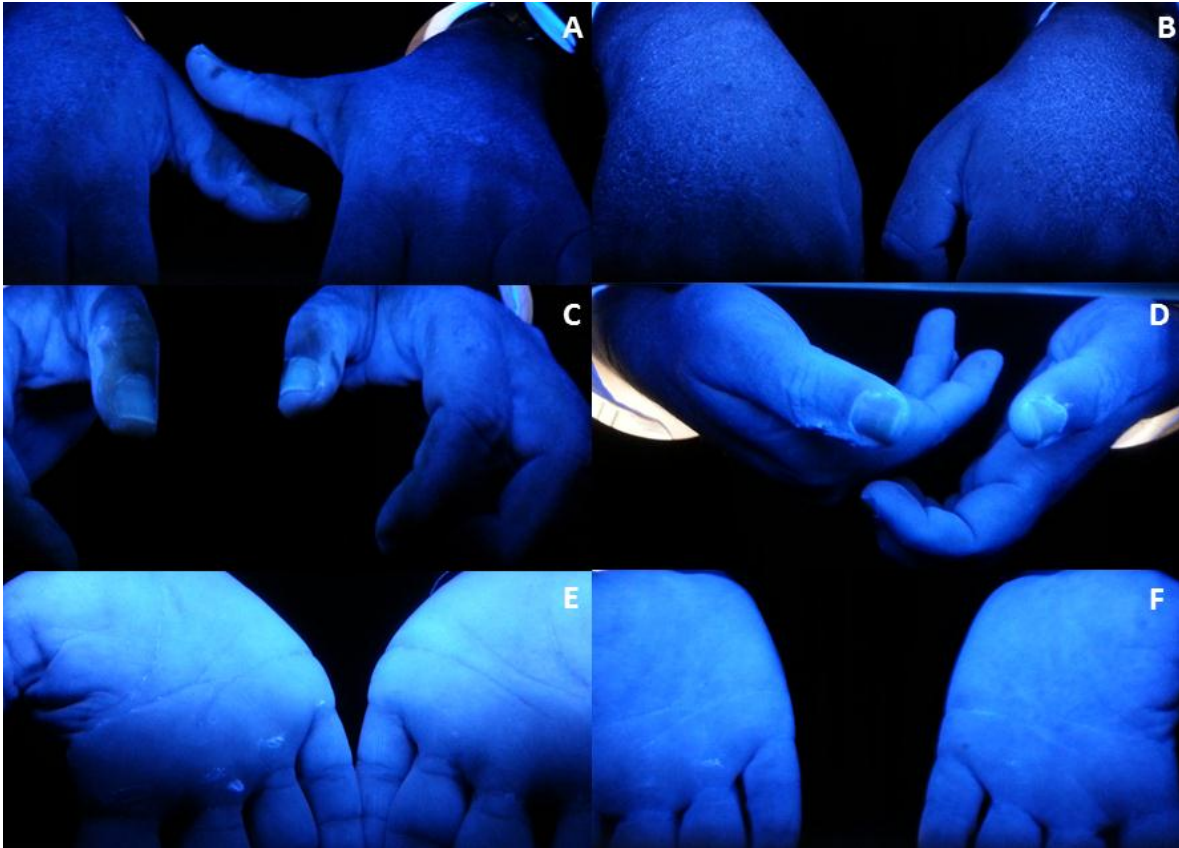
Figura 2. Imágenes del proceso de evaluación de la calidad de la higiene de manos, realizada con la utilización de una caja negra con lámpara de luz ultravioleta, donde se introducen las manos después de un lavado con solución alcohólica con marcador (Fluo-Rub de B-Braun). En A se visualiza el dorso de las manos con marcado no homogéneo y en B , marcado homogéneo compatible con técnica adecuada. En C se destacan zonas oscuras en ambos pulgares compatibles con mala técnica y en D marcado homogéneo en las zonas visibles de los dedos. A su vez E muestra zonas oscuras en palmas de manos, en la proximidad de la zona digital y F muestra marcado homogéneo en palmas de manos. [Imágenes de investigación en curso en el Centro de Investigaciones Médico Quirúrgicas]

donde se introducen las manos para inspección después de realizar un lavado habitual y luego un lavado con solución alcohólica con marcador (Fluo-Rub de B-Braun), muestra incidencia moderada de baja calidad en la higiene de manos y predominio de zonas oscuras en el área de los dedos. Figura 2.